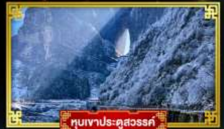
หมู่บ้านประตูล้อมรั้ว