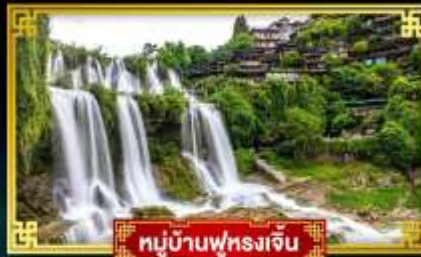
หมู่บ้านฟุรงเจิน