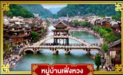
หมู่บ้านเฟิ่งทง

สุดคุ้ม!! พิเศษ 5 ดาว ทุกคืน เที่ยว 2 เมืองโบราณแดนมังกร